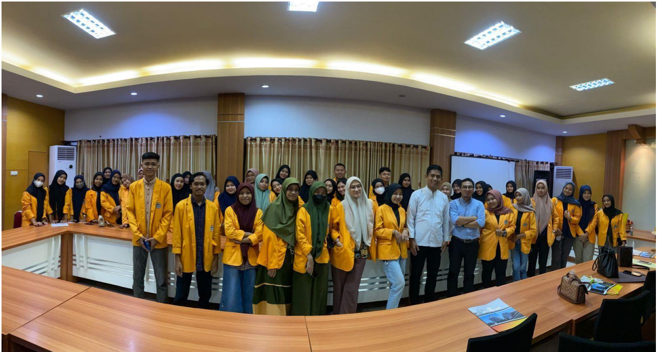
Gambar 2. Pelaksanaan Seminar dan Pelatihan Kuliah, Beasiswa, dan Karier