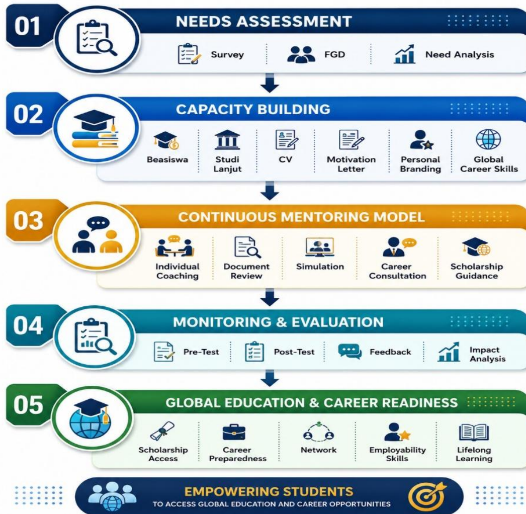
Gambar 1. Model Pendampingan Berkelanjutan bagi Mahasiswa dalam Mengakses Pendidikan dan Peluang Kerja Global

readiness. Hubungan antartahapan tersebut disajikan pada Gambar 1.